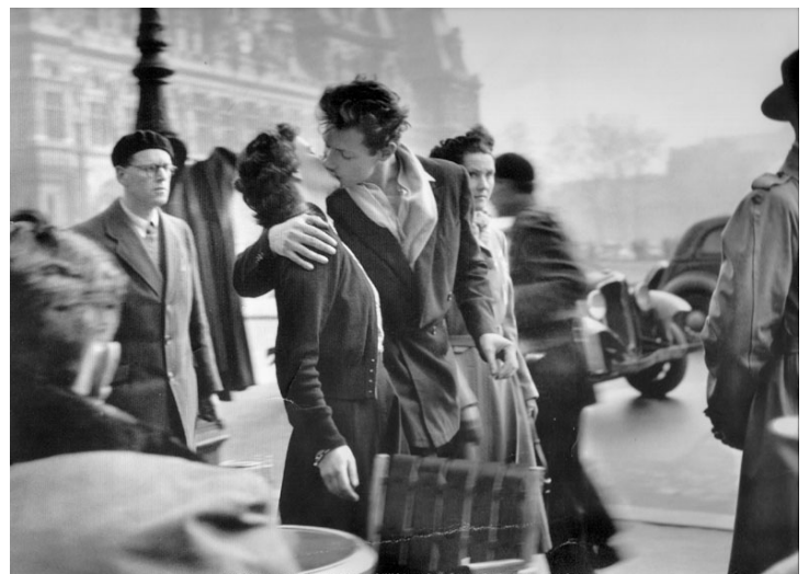
Le Baiser de l'Hôtel de ville , Doisneau 1950