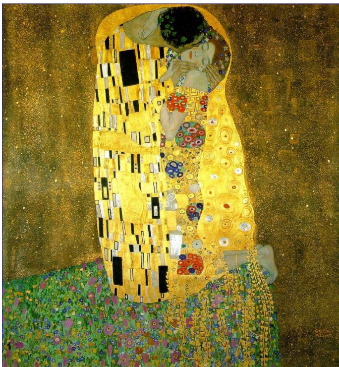
Le Baiser , KLIMT, 1908